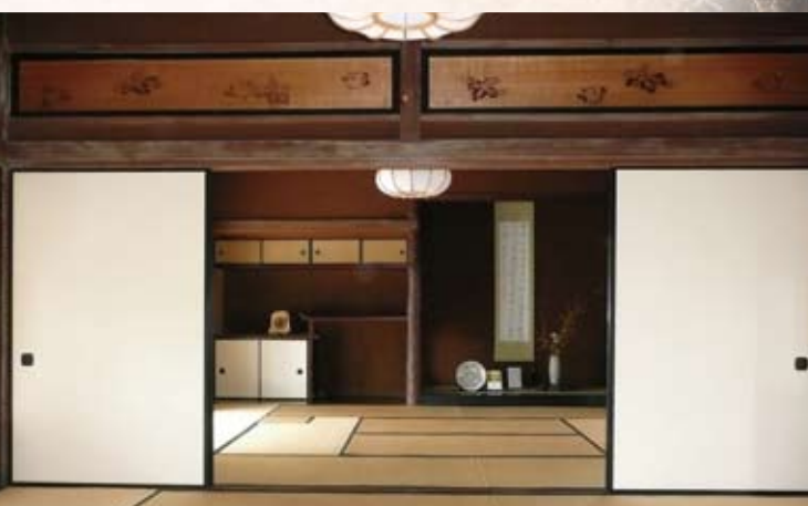
岩村には珍しい書院風の離れ。