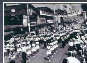
昭和40年岐阜国体のパレード