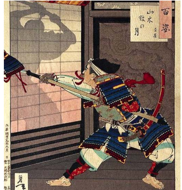
『山木館の月』(月岡芳年『月百姿』)兜を囷にして 山木兼隆に斬りかかる加藤景廉

生没:保元元年(1156年)? ~承久3年(1221年) 源頼朝とともに平氏打倒に数々の武功をたて、鎌倉幕府樹立後も頼朝の信任は厚く重用される。頼朝に仕える間に美濃国恵那郡遠山荘を領地として与えられ、その後長男の景朝が岩村城を本拠として遠山姓を名乗り、岩村城の実質的な歴史が始まっていく。後年は、源実朝暗殺の監督不届きの責を負い、出家。遠山の金さん(遠山景元)は分家の子孫。