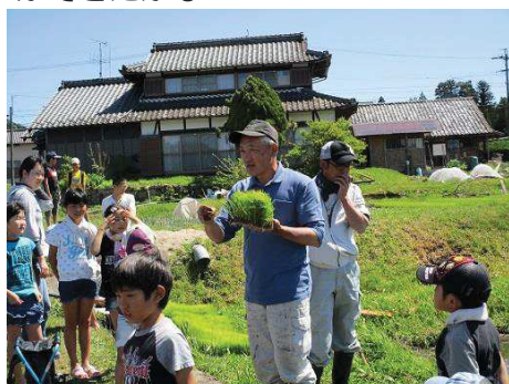
これくらいずつ植えるんだよ～