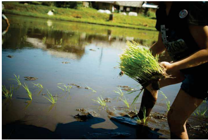
ここから自分の食べるお米が育つ