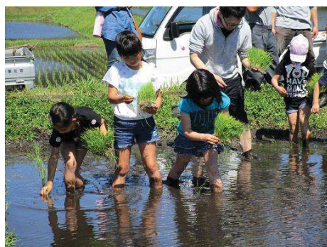
うまく植えられているかな？