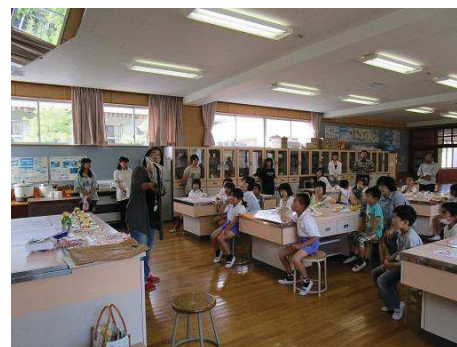
ヘンゼルとグレーテルのお話に興味津々

お問い合わせ：恵那市まちづくり推進部生涯学習課 43-2112（内 343） 田口 西尾