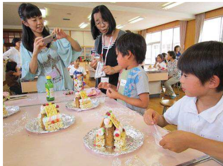
おいしそうなお菓子の家ができそう！

6月2日のいわっこクラブは、お菓子の家を実際に作り、「ヘンゼルとグレーテルの世界」を体験しました。講師の方に絵本を読んでもらい、子どもたちはお菓子の家のイメージがふくれあがったようです。それぞれ思い思いのお菓子の家を作りました！素敵な家のできたので食べるのがもったいなくなってしまい、持ち帰ることになりました。おいしく食べるのができたかな？