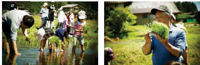
世代を超えた交流も魅力的