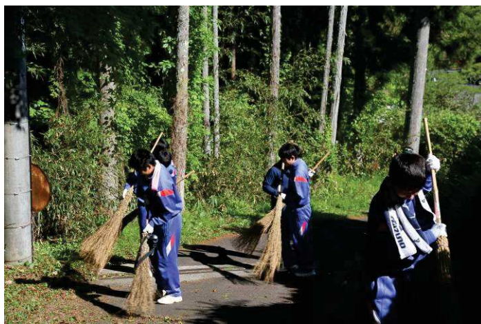
町の宝物を自分たちの手で守る