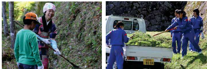
自分のできることから、力を合わせて