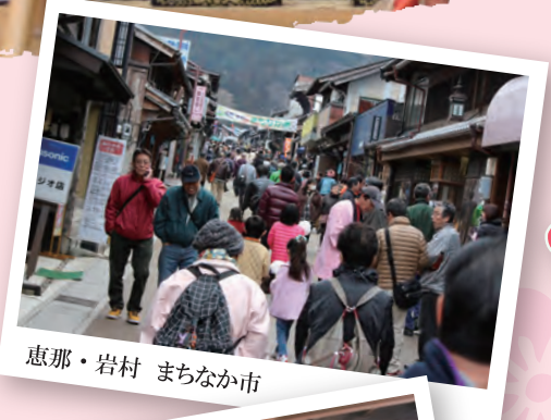
恵那・岩村 まちなか市

恵那地方は寒冷地のため 花が咲く時期が遅いことから 四月三日にひなまつりを祝うという 風習が古くから伝えられています。