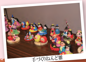
手づくりねんど雛