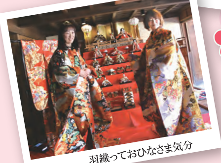
羽織っておひなさま気分