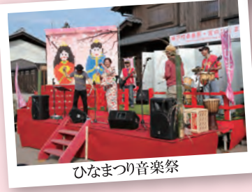
ひなまつり音楽祭