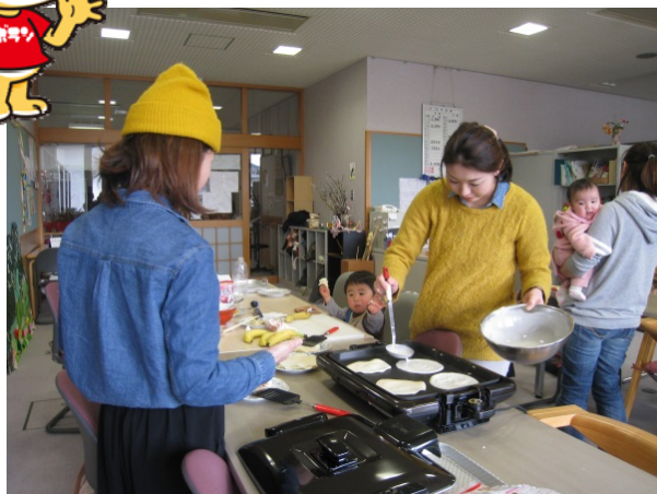
親子遊びの場 (おやつ作り)