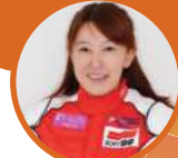
国際A級レーサー 井原慶子さん