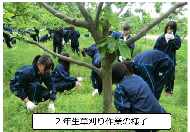
2年生草刈り作業の様子

恵那南高校では魅力ある教育活動の一つとして、恵那市の特産品である「栗」を素材とした6次産業教育をおこなっています。