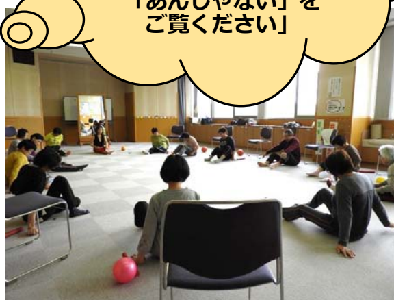
健康トレーニングの様子

7月28日（土）9:30～ 12:00（10:30開演） 岩村コミセンにて 三世代交流大会 「さんさん劇場」 を開催します!! 詳しくは社協だより 「あんじゃない」を ご覧ください