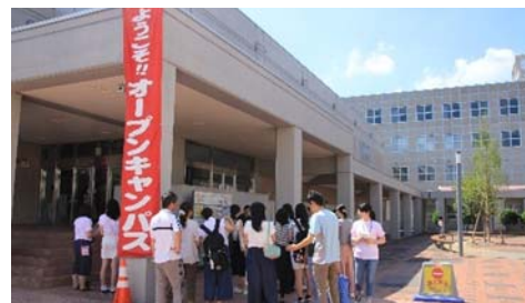
多くの来場者で賑わう日野キャンパス