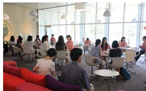
たくさんの学生スタッフがお迎えます

実践女子学園は、岐阜県岩村町出身下田歌子先生が「女性が社会を変える、世界を変える」との信念のもと、1899年（明治32）年に創立されました。現在は、東京都渋谷区、日野市の2キャンパスで、大学、短期大学、中学校高等学校の学生・生徒約6,300名が学んでいます。