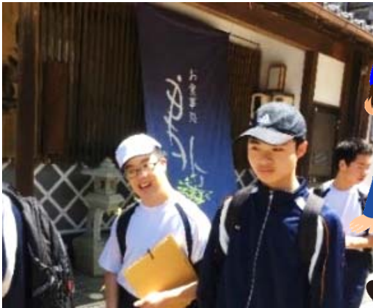
高等部：岩村町内にて

高等部1年の生徒たちは、岩村ハイキングに出かけました。新緑いっぱいの心地よい気候の中、クラスごとに事前に学習した岩村町内の目的地を確認しながら、町内の街並みを見て回りました。町内を見て回る中、現在NHKで放送中の朝の連続テレビ小説「半分、青い。」の撮影場所に気づく生徒もあり、「あ、ここ半分、青い。だ。」と言う声が聞こえ、岩村の街並みを楽しんでいました。