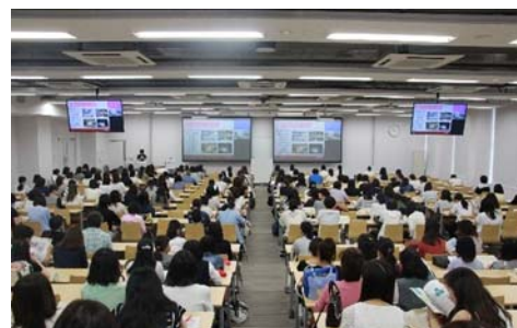
渋谷キャンパスでの「実践総合ガイダンス」

詳細については、本学公式webサイトでご確認ください。 http://www.jissen.ac.jp/