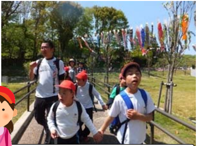
小学部：瑞浪市民公園にて

新緑のきれいな季節となってきました。4月下旬から5月初旬にかけて、当校、小学部・中学部・高等部の児童生徒たちは校外学習に出かけました。