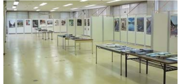
休憩所の反対側には、岩村・恵那市のほか、東美濃の各市のポスター・パンフレットが置かれているスペースがあります。

(一社)恵那市観光協会岩村支部(岩村町観光協会) TEL/FAX 43-3231 kankou@iwamura.jp