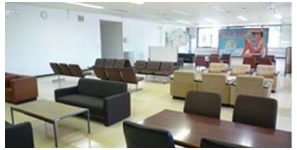
「半分、青い。」のロケセットのアーチやパネルと休憩スペース