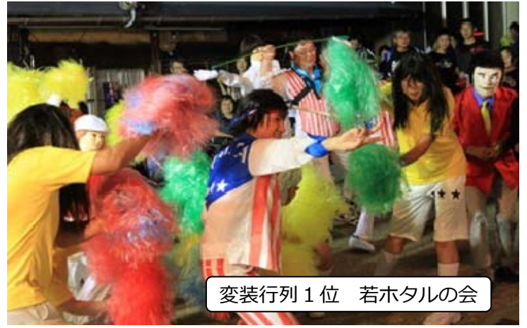
変装行列 1位 若ホテルの会