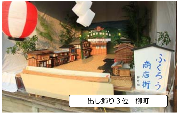
出し飾り 3位 柳町