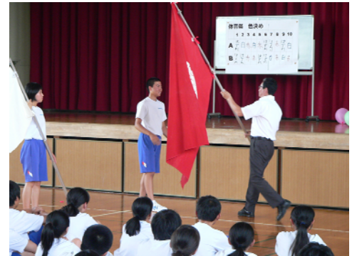
校長先生より団旗の授与