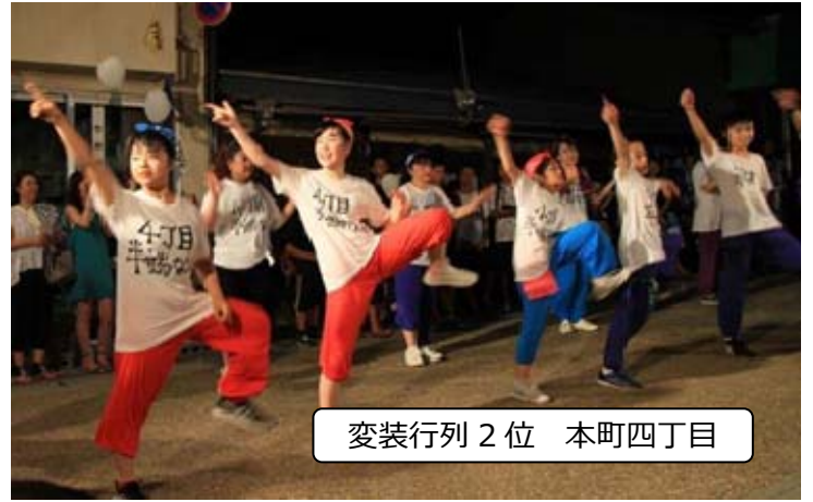
変装行列 2位 本町四丁目