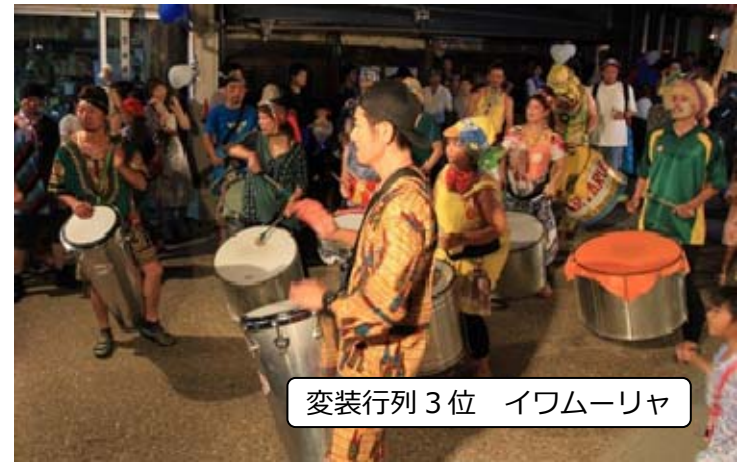
変装行列 3位 イワムーリヤ