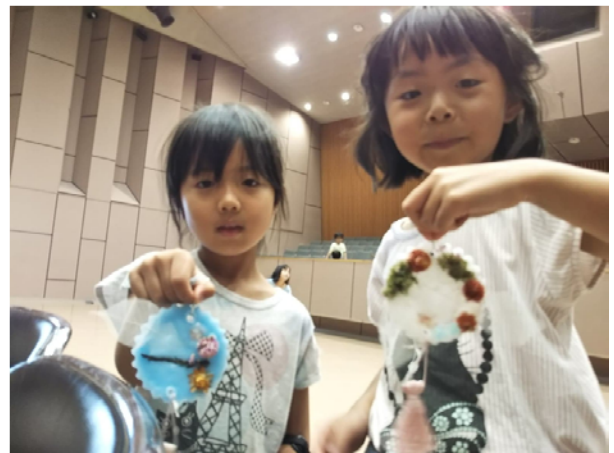
アロマワックスバーづくり

地域の大人が講師となり、中学生がそれをサポートする。【地域の子どもは地域で育む】取り組みとして充実した1日でした。