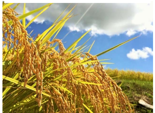
9月22日（土）は稲刈り体験

また、稲刈りの後は、城下町ホットいわむらの皆さんによる五平餅づくり体験があります。お米を育てて、食べるをテーマに教えていただきます。