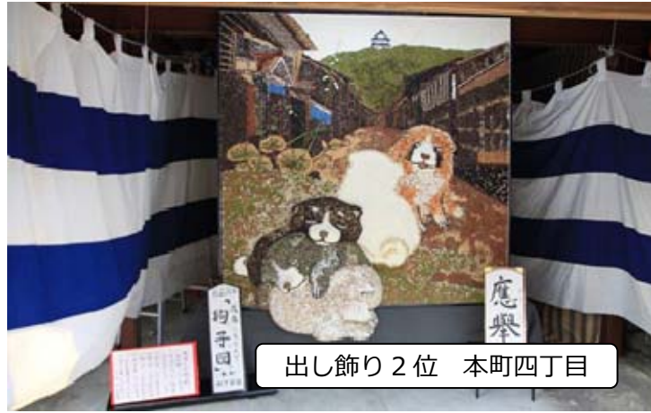
出し飾り 2位 本町四丁目