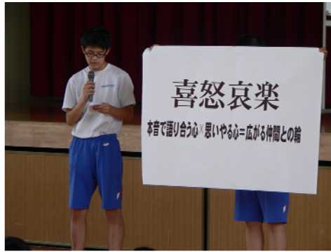
平成 30 年度 体育祭スローガン

練習は初日から熱気をおびています。9月8日（土）はぜひ、そんな姿を見に来て下さい。