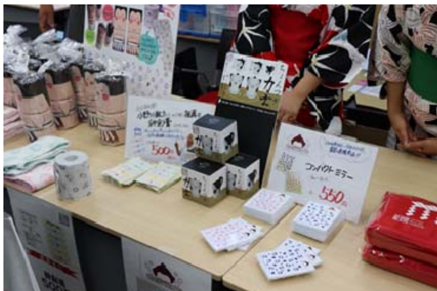
発表会会場では、学生たちが開発した産学連携商品と日本相撲協会の公式グッズが販売された