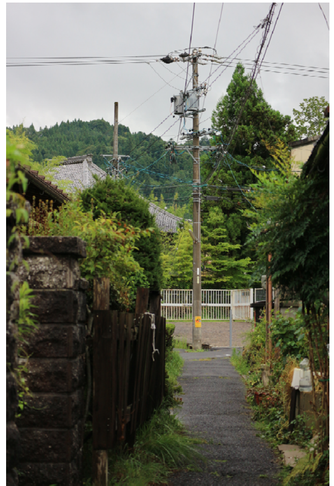
長屋の路地から望見した城山と妙法寺本堂

長屋の路地に立ってみると、正面に妙法寺本堂と岩村城を並んで仰ぎ見ることができます。この路地は、本通りや樺の馬場と同じように、お城が望見できるように設計されていたのです。 (恵那市職員 三宅唯美)