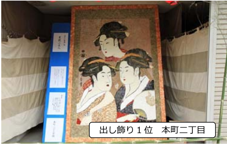
出し飾り 1位 本町二丁目