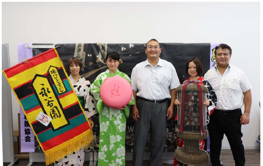
発表を行った学生たちと三保ヶ関親方、振分親方

岩村町の皆様も両国国技館に足を運ばれた際は、ぜひ、本学学生デザインのグッズをお買い求めいただければ幸いです。