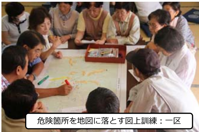
危険箇所を地図に落とす図上訓練：一区

自治会独自で、消火栓からの放水訓練や災害を想定した図上訓練などが行われ、西町庚申堂前では、少年消防隊・地元中学生・女性消防隊が一斉放水の訓練を行いました。また、ふるさと富田会館では、日赤奉仕団・女性防火クラブの炊き出し訓練に加え、災害派遣の際に使用される自衛隊車輛の展示などがありました。訓練は小学校・中学校でも行われ、地域の防災を考える良い機会となりました。町内各地の訓練の様子を下記の写真をご覧ください。