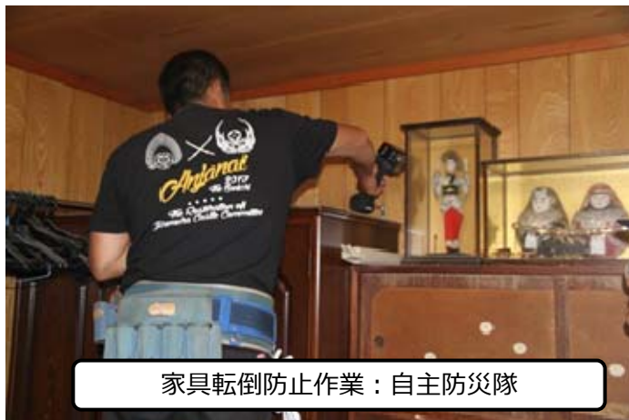
家具転倒防止作業：自主防災隊