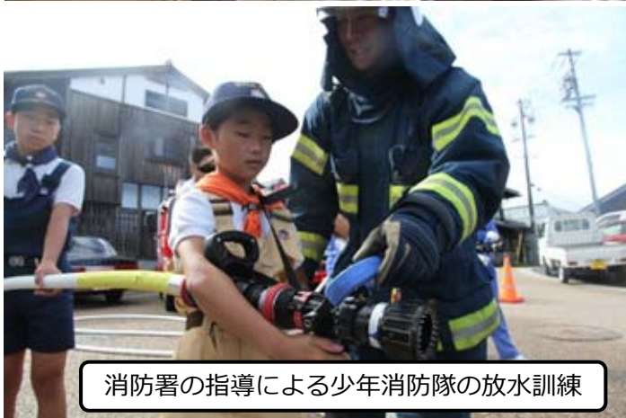
消防署の指導による少年消防隊の放水訓練