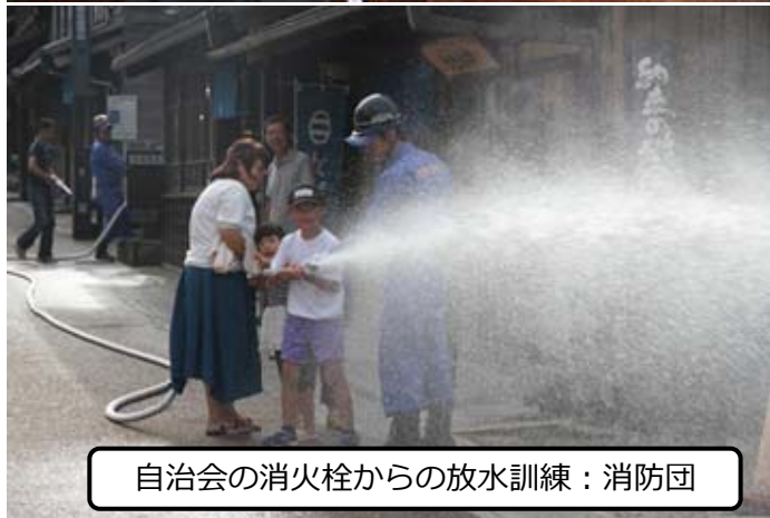
自治会の消火栓からの放水訓練：消防団