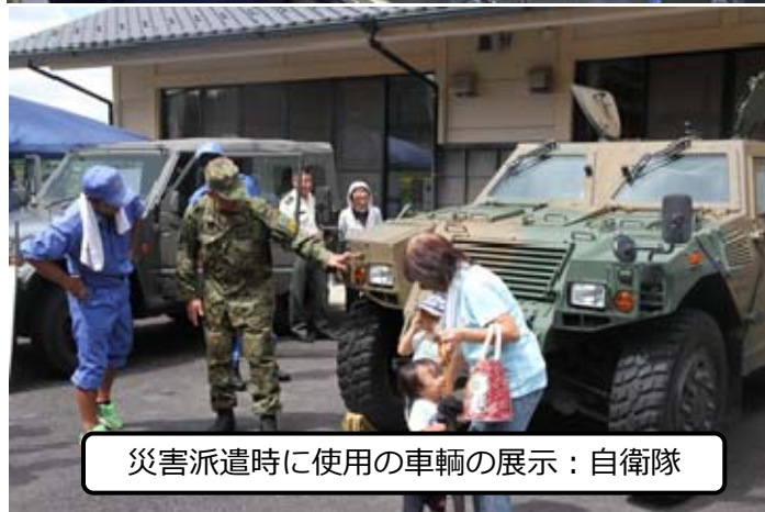
災害派遣時に使用の車輛の展示：自衛隊