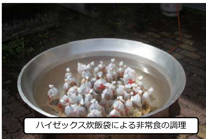
ハイゼックス炊飯袋による非常食の調理