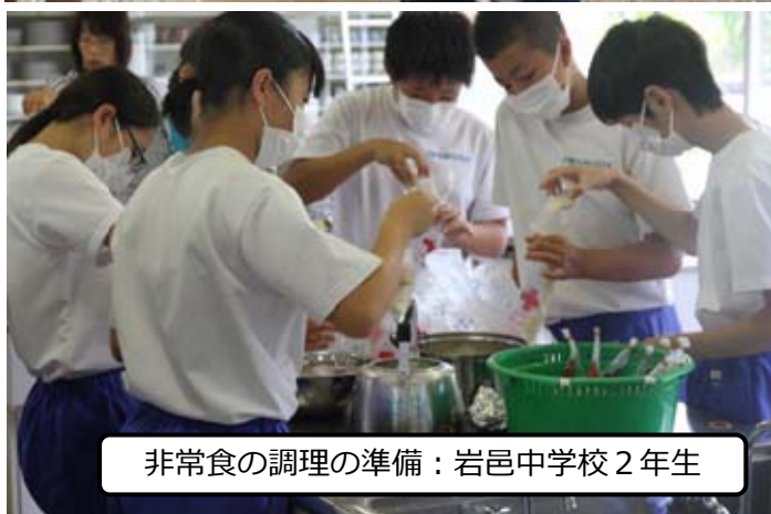
非常食の調理の準備：岩邑中学校2年生