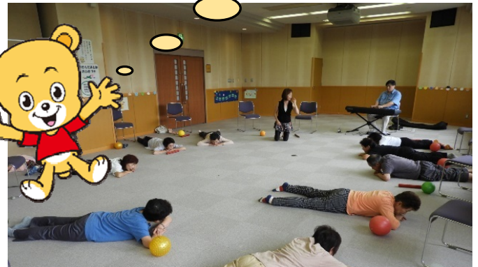
健康トレーニング音楽コラボの様子