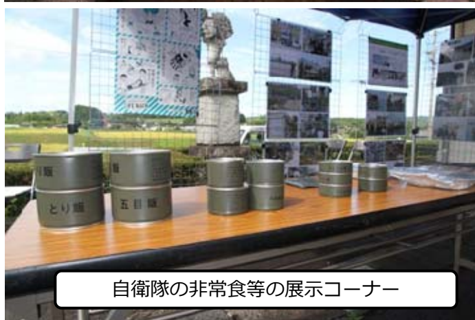
自衛隊の非常食等の展示コーナー