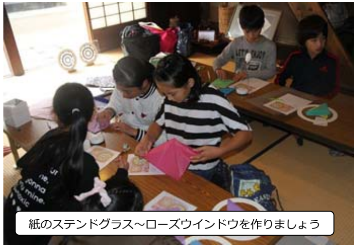
紙のステンドグラス～ローズウインドウを作しましょう