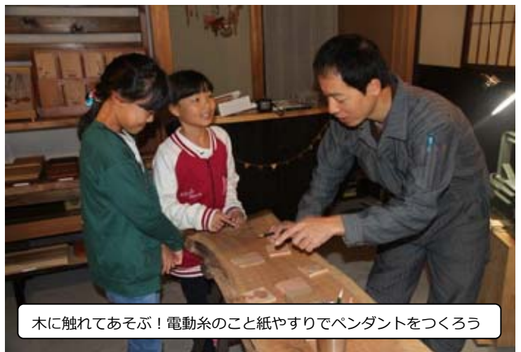
木に触れてあそぶ！電動糸のこと紙やすりでペンダントをつくろう