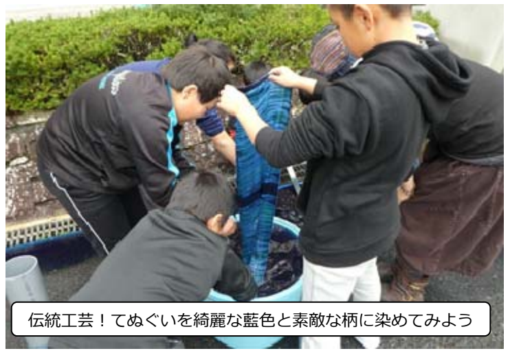
伝統工芸！てぬぐいを綺麗な藍色と素敵な柄に染めてみよう