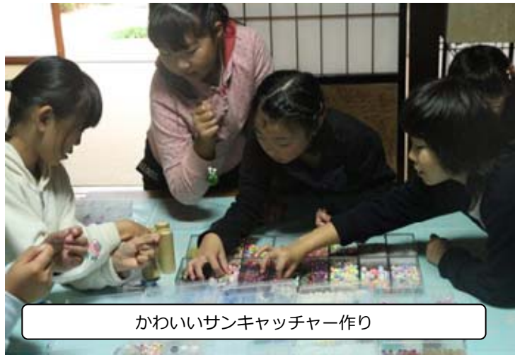
かわいいサンキャッチャー作り