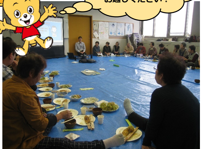
いこまい会五平餅会で、 デマンドバスの説明を受けました