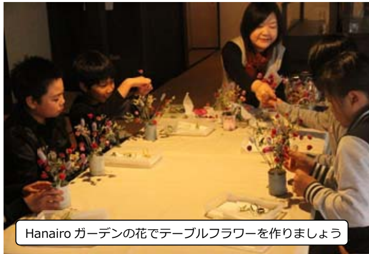
Hanairo ガーデンの花でテーブルフラワーを作しましょう