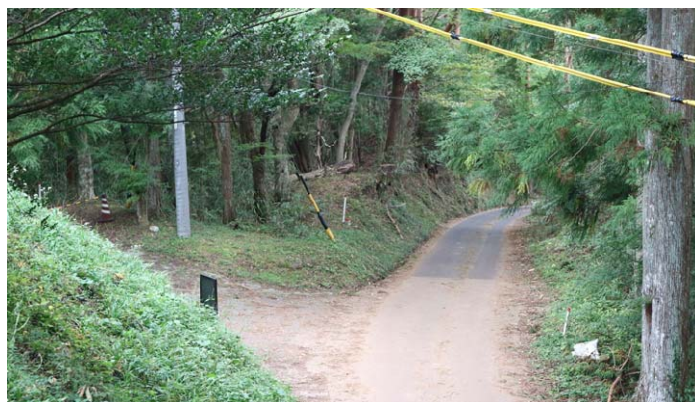
現在の越兵衛屋敷。曲輪の一部がわずかに残っている