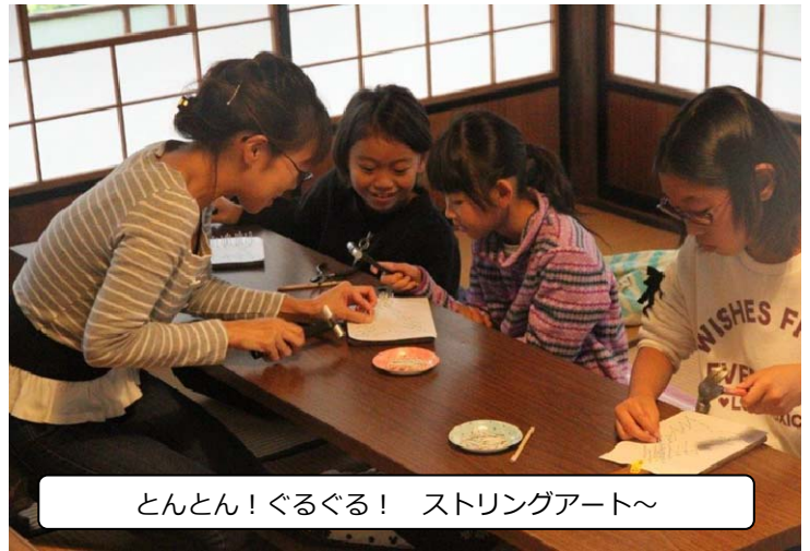
とんとん！ぐるぐる！ スtringアート～