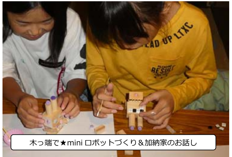
木っ端で★mini ロボットづくり&加納家のお話し