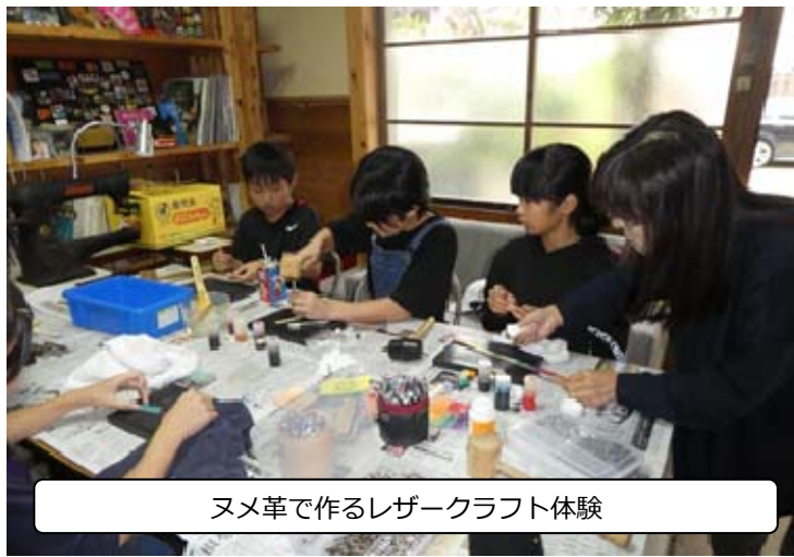
ヌメ革で作るレザークラフト体験