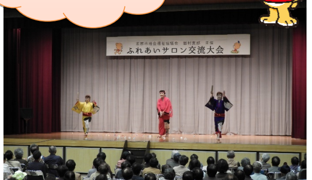
ふれあいサロン交流大会「劇団さむらい」のステージ