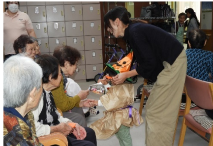
ハロウィン仮装でデイサービス訪問 (親子遊びの場にて)