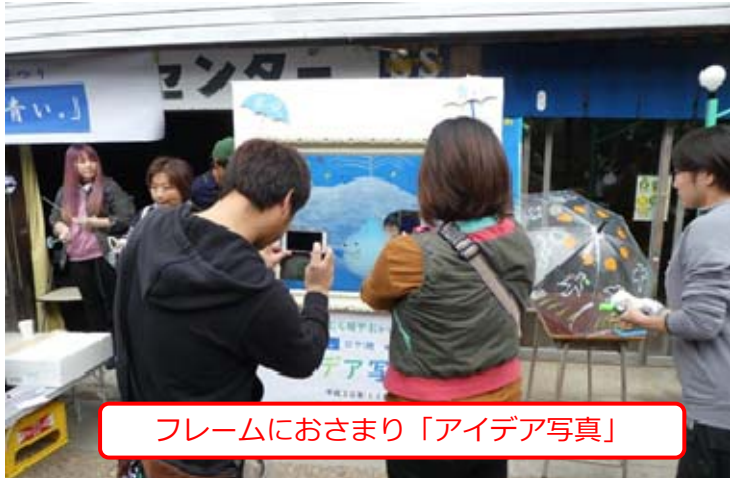
フレームにおさまり「アイデア写真」