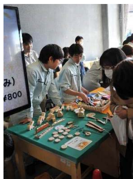
ロックビレッジバザールの様子