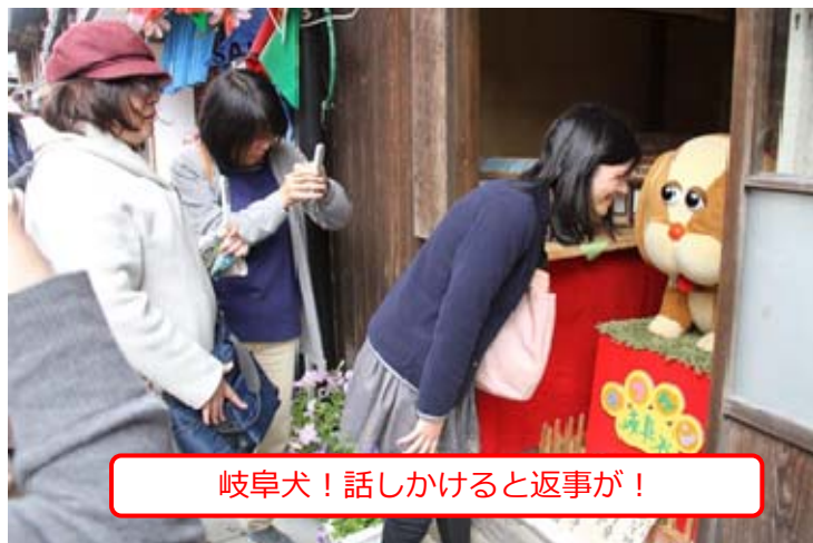
岐阜犬！話しかけると返事が！

いわむら城下おかげまつり・ふくろうまつりでは、「しゃべる岐阜犬」や「フレーム絵や文字を書き入れ、そのフレームに納まって記念撮影ができる「アイデア写真」のコーナー」など、様々な企画やアトラクションが催されました。