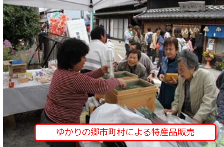
ゆかりの郷市町村による特産品販売