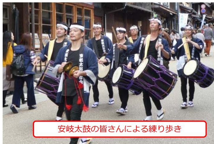
安岐太鼓の皆さんによる練り歩き