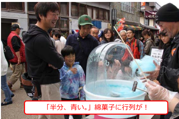
「半分、青い。」綿菓子に行列が！