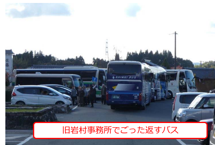
旧岩村事務所でごった返すバス