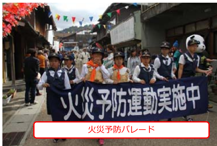
火災予防パレード