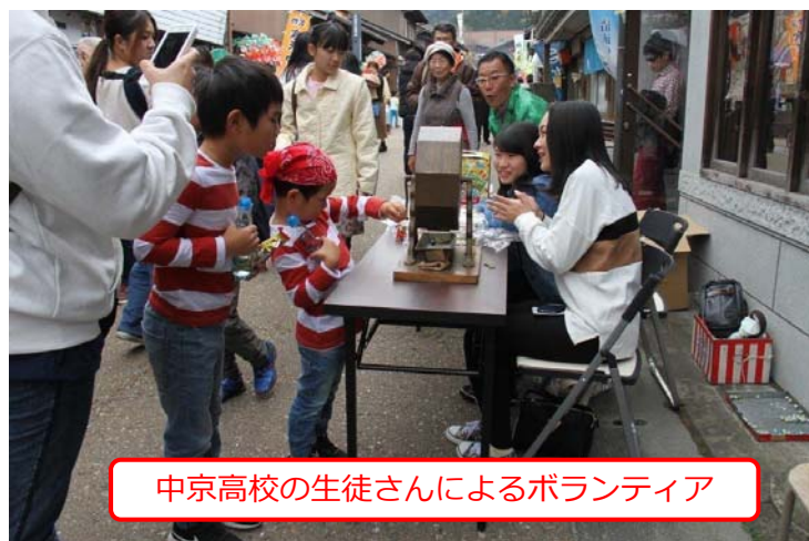
中京高校の生徒さんによるボランティア