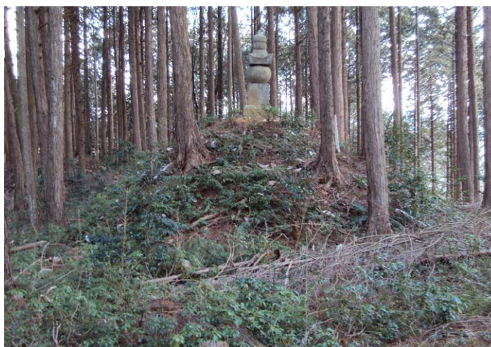
塔ヶ根 3号経塚の全景