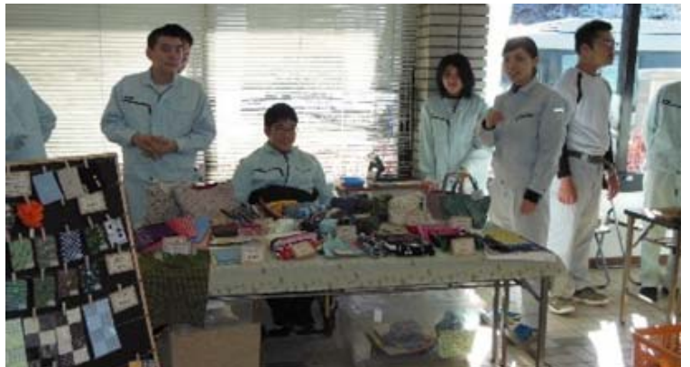
2月1日、2日 高等部 販売会の様子

3月に卒業を迎え、社会に出ていく生徒も多い中、たくさんのお客さんと触れ合うことができ、貴重な体験をすることができました。ご来場いただいた地域の方々には、改めてお礼申し上げます。