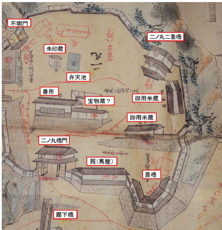
『濃州岩村城并居屋敷家中屋敷町屋敷絵図』 (18世紀初頭、市指定文化財)に描かれた二の丸