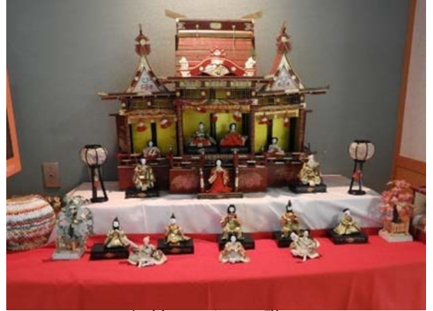
福祉センター1階に たくさんのおひなさまを飾りました