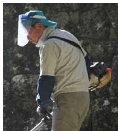
フェイスシールドを着用しての作業