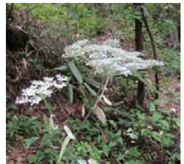
シラネセンキュウ