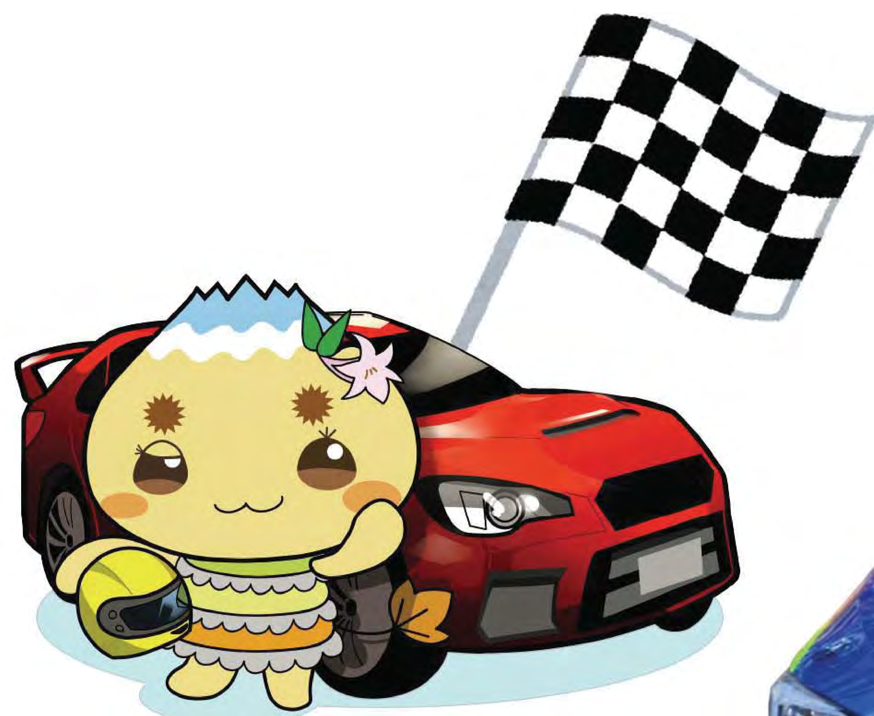
恵那市公式キャラクター 「エーナ」