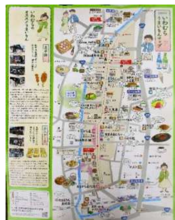
いわむら うまいもんマップ

観光協会協会では、そのほか町並み、お城マップ、ポストカード等多数そろえていますので、ぜひご利用ください。知人等に無料で郵送もいたします。