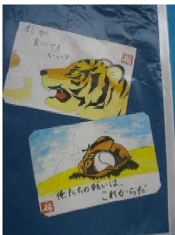
< 生徒が作成した絵手紙 >

この学習の成果を「作品展示」「掲示」「演示」「大会出場報告」といった形で発表する場が「温故知新発表会」です。例年、講師の先生方や保護者、地域の皆様をお招きして発表会を開催するのですが、今年度はリモート配信で実施しました。生徒たちは、取り組みを通して感じたことや成長できたことを作文にまとめ、講師の先生方へお届けしました。