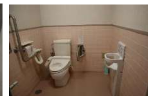
多目的トイレにベビーチェアが備え付けられました