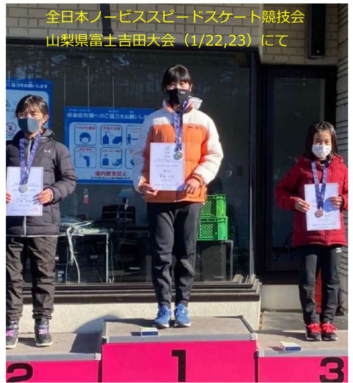
全日本ノービススピードスケート競技会 山梨県富士吉田大会（1/22,23）にて