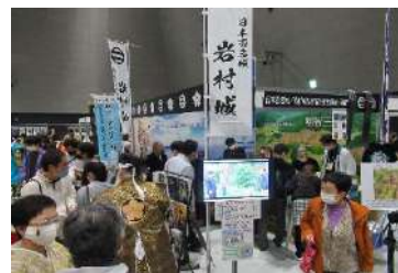
昨年の「にっぽん城まつり 2021」の展覧風景

昨年は2日間で6000人の入場者があり、明知城と共に恵那市山城のPRをしましたが、今年は10月に開催される「第29回全国山城サミット恵那大会」もあり、大々的にPRします。ぜひご来場ください。