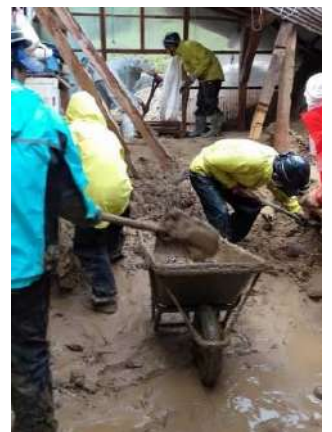
（土砂災害復旧の様子）

お問い合わせだけでも構いません、興味がありましたら下記連絡先までご連絡ください。