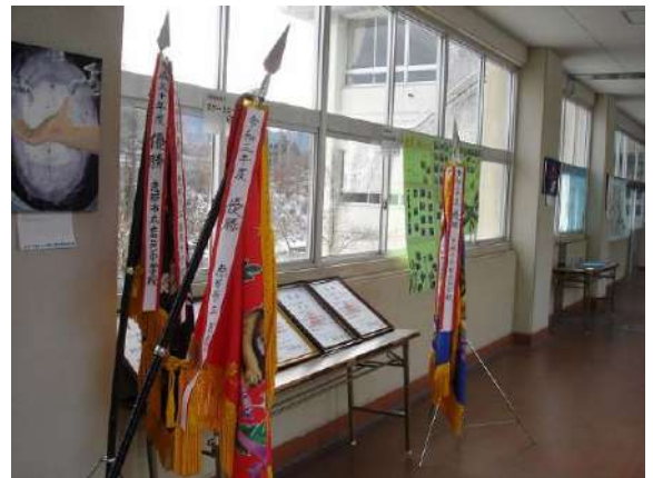
< スケート県大会団体の優勝旗・賞状 >

岩邑中学校では、総合的な学習の時間に岩村の伝統や文化を学ぶ「温故知新」の授業を行っています。この授業が始まったのは15年以上も前のことで、岩邑中の伝統のひとつになっています。地域講師の先生方に年間13回ほどお越しいただき、岩村の良さを受け継いでいこうとする心を育てることを目指して熱心にご指導いただきます。今年度は、①絵手紙 ②スケート ③染め型紙 ④弓道 ⑤歴史 ⑥自然 ⑦岩村の味 ⑧女太鼓の8コースに分かれて取り組みました。(雅楽コースは休止)