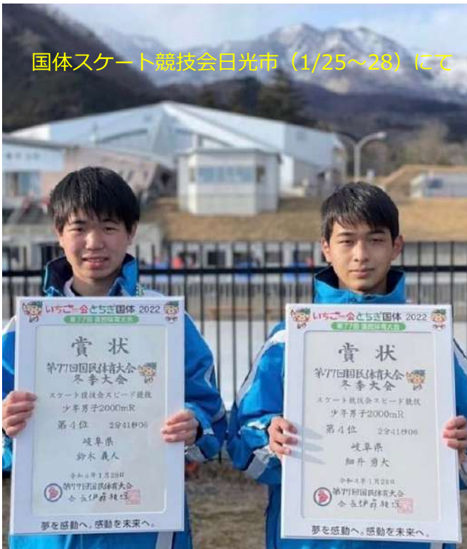
国体スケート競技会日光市（1/25～28）にて