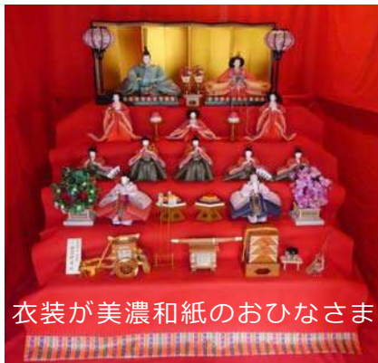
衣装が美濃和紙のおひなさま