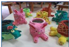
素敵な鉛筆立てができたね

事前に園長先生に作り方を教えて貰ったり、油粘土で練習していたため、当日は「しっぽつけよ!」「耳は引き出して作るんだよね」「消しゴムを置くところも作る」と、どんどん自分で作り進めていく子が大勢いたね。中には「え〜できんもん」と悪戦苦闘する子もいましたが、先生に手伝ってもらいながら「リボンも作る」「帽子もいる!」と自分だけの素敵な鉛筆