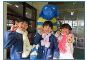
頑張って編んだマフラー あったか〜い

昔から岩村に伝わってきた先生達手作りの編み機でのマフラー編み。初めはぎこちない手つきで毛糸の扱いにも慣れない子ども達でしたが、何度も繰り返す中で、自分なりのコツをつかんでどんどん編み進んでいきました。根気と集中力が必要なマフラー編みですが、編む度にどんどん長くなっていくのがうれしくて、張り切ったみんなだったね。