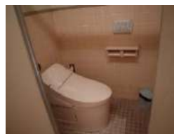
男女トイレの洋式化