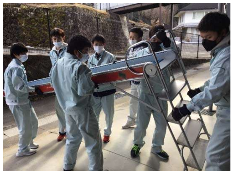
< 高等部3年生は校舎の清掃作業 >

卒業を間近に控えた小学部6年生、中学部3年生は次の学部の授業や時間割を予習したり、卒業制作に取り組んだりしています。小学部はペットボトルで花壇作り、中学部は保冷バック作りを行っています。仲間と協力して満足のいく作品作りを目指しています。また、高等部3年生はお世話になった校舎の清掃作業を行いました。高等部卒業後は地域の作業所や企業で社会人として働きます。作業学習や学校生活で学んだことを生かして、働く人として社会の中で役に立つ人材になってほしいと思います。