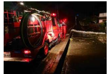
（災害現場に急行する消防団）