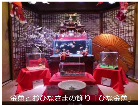
金魚とおひなさまの飾り「ひな金魚」