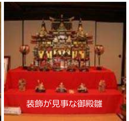
装飾が見事な御殿雛