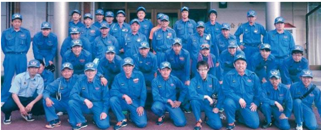
（入団者お待ちしております!）