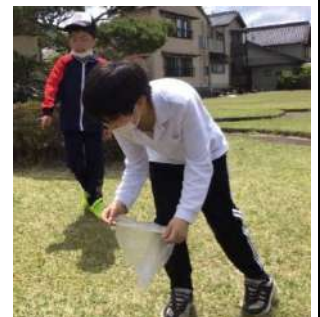
小学部： 春の虫見つけの様子

中学部1年生は河川公園に出掛けました。道中の岩村城下町では、五月人形や鯉のぼりなど季節のものを見付けながら歩きました。河川公園では芝生の上で思い切り駆けまわったり、岩村駅に停まる列車を見たりして楽しみました。