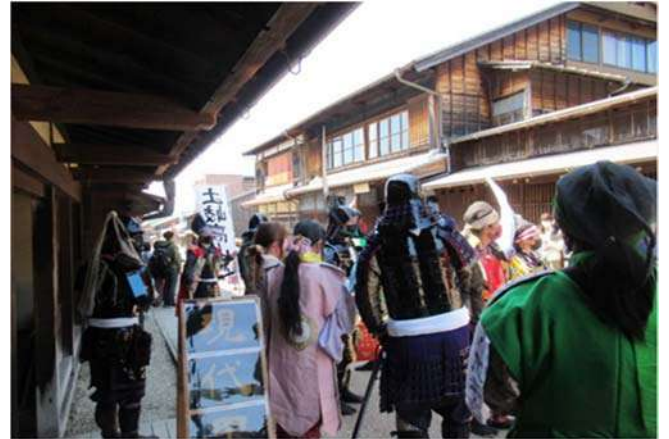
<煌びやかな甲冑姿>