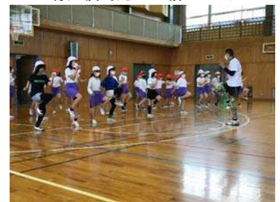
<ももを高くあげる!!!>