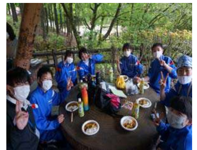
<カレー作りに挑戦>

<1年生の集合写真> 以上に元気な姿で2日間を過ごしました。ウォークラリーでは、グループのメンバーと知恵を出し合ってゴールを目指しました。キャンプファイヤーでは、「フォークダンス」「猛獣狩り行こうよゲーム」「進化じゃんけん」などで大いに盛り上がりました。2日目に挑戦したカレー作りでは、初日の研修で作った手作りスプーンでおいしくいただきました。生徒たちの笑い声が周囲の山々に響き、とても爽やかで実りある研修となりました。旭高原研修で深めた仲間とのつながりを、これからの中学校生活で生かしていきます。