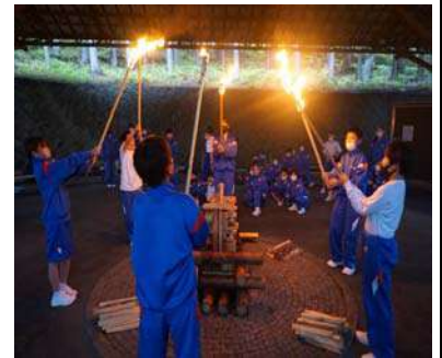
<心躍るキャンプファイヤー>

5月12・13日の2日間、1年生が「愛知県旭高原自然の家」で宿泊研修を行いました。過去2年間は宿泊ができず、根の上高原での研修でしたが、今年度は当初の計画通り実施することができました。心配された雨の影響も少なく、1年生は日頃の学校生活