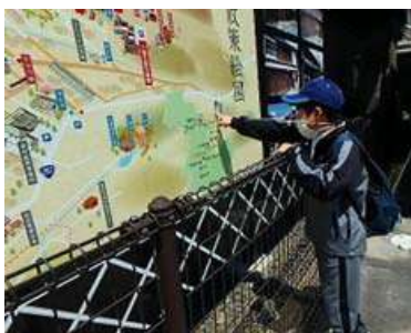
中学部： 岩村駅に立ち寄りしました

小学部3・4年生は岩村いきがい会館に遠足に出掛けました。いきがい会館では、春の虫である蝶々を見付け、静かに近づいて観察したり、暖かな陽気の中で友達と一緒にシャボン玉を飛ばしたりして楽しみました。