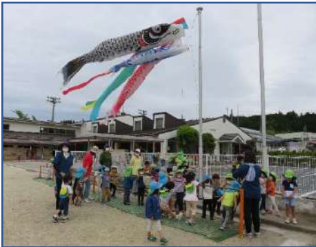
<鯉のぼりを見ながら、歌をうたったよ>

少し前まで「ママ～」と泣いていた新入児の子どもずいぶん園の生活に慣れ、砂場で泥んこ遊びを楽しんだり、三輪車でところせましと園庭をこぎ回って遊べる様になってきました。朝の遊びはこどもの一日を決める大事な時間です。年少組は新しいクレヨンを受け取りニコニコしながらグルグル書きを楽しみました。年中組は、ひまわりの花や大豆の種を蒔いたり、キュウリの苗も植えました。年長組はニンジンの種蒔きや、すでに植えたジャガイモの成長を楽しみに観察しました。「遊びと仕事でこどもを育てる」を目標に令和4年度岩村こども園の活動が少しずつ動き出したこの頃です。未満児のうさぎ組さんは、お散歩が大好きだね。いちご・ひよこ組は、よく泣けて、おんぶに抱っこ、乳母車で園庭ドライブが続いています。コロナ感染症には気を付けながら、明るく元気に過ごしたいと思います。