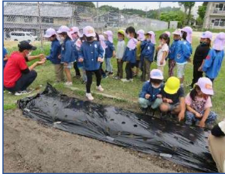
<年長さん、ニンジンの種蒔>