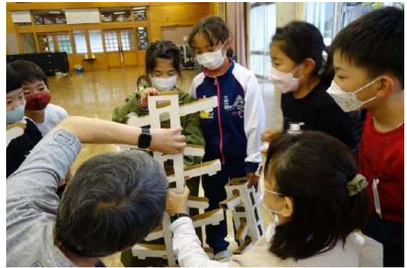
<ダンボールでピタゴラスイッチ>