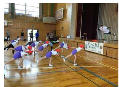
<先生の指導わかりやすいです>