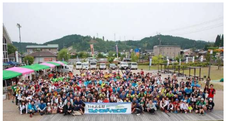
<昨年のフォトログeyニングの様子>

電話:0572-65-4770 Mail:ena.photo.rogaining@gmail.com