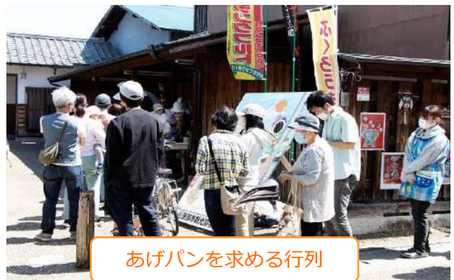
あげパンを求める行列