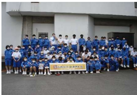
<城山清掃後の集合写真です>