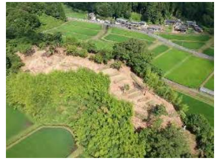
<飯羽間城跡の空撮>