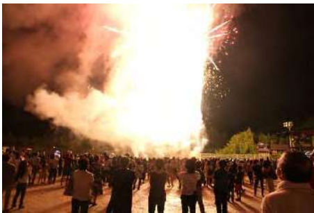
<音楽花火。光がほとばしっています>