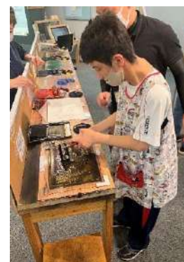
<重ね摺り体験の様子>

7月5日、高等部2年生が校外学習で中山道広重美術館に出掛けました。版画の重ね摺りを体験したり、浮世絵を鑑賞したりしました。重ね摺り体験では、それぞれに違った味のある版画を摺ることができました。浮世絵の鑑賞では、作品の紹介を聞いて、浮世絵が一人ではなく、彫師や摺師など何人かで作られていることやハートに似た形が昔、猪目といわれる模様だったことなどを知り、浮世絵や歴史への関心を深めることができました。