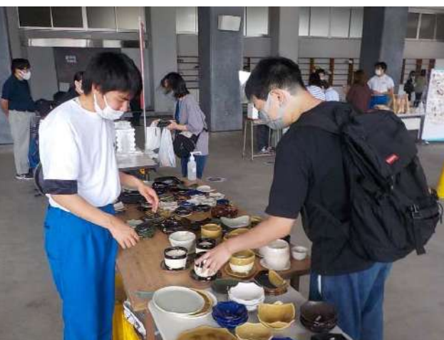
<ロックビレッジバザールの様子>

7月21日、全校の保護者を対象に高等部・中学部合同ロックビレッジバザール（作業製品販売会）を実施しました。1学期のまとめの活動として、1学期間に真心込めて