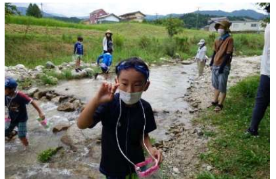
<カニをつかまえたよ！>