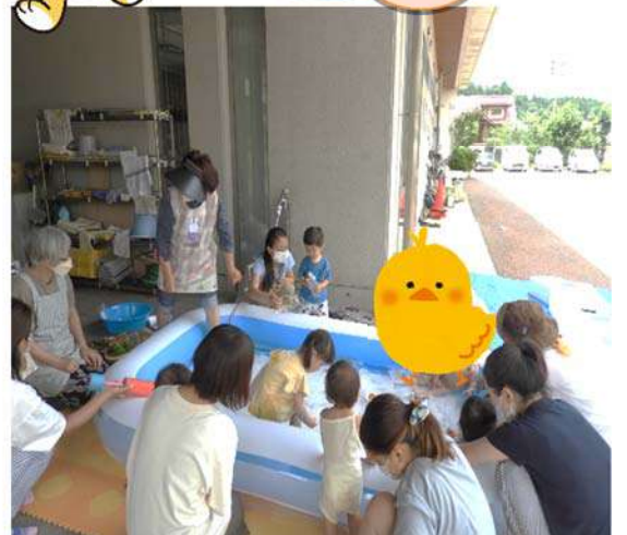
<親子遊びの場 プール遊びの様子>

9月13日(火)午前10時半～11時半 プール遊び 9月27日(火)午前10時半～11時半 読み聞かせ など