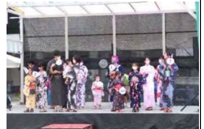
<魅惑のファッションショーでした>