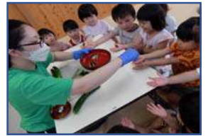
<ちくちくキュウリです>

保育室裏の桜の木で鳴き続ける蝉を指さし、先生に教えて貰って折った蝉を、上に下にと揺らし「み～ん み～ん」と走り回る年少さん。地域の方に頂いたカブトムシの幼虫がやっと孵って、「これはオスだよ」「この子は女の子だね」と集まって見合うこども達。夏はこどもにとって色んな虫にも出会える楽しい季節です。2才児の先生がこんな話をしてくれました。「こどもに種を見せながら蒔いたキュウリだけど、小さいからまだ興味が持てないかなあと思っていた。でも、小さいジョウロで水をやり、フェンスの向こうから、つるが伸び大きくなっ