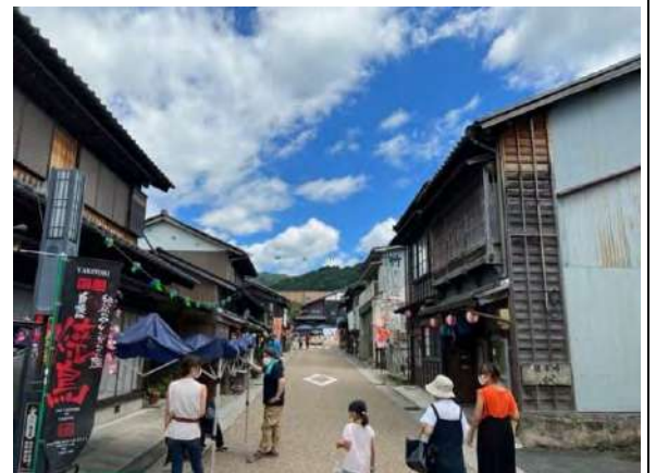
<晴天の中ふくろうまつり開催!!>