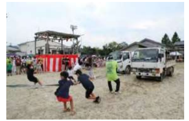
<筋肉の躍動。ダンブ引き!!>

やはり目の前で見える音楽花火は迫力があり、約3,000人の観客からは「来てよかった」や「楽しかった」など歓声が上がっていました。来年もぜひご来場ください。みなさんご参加いただきありがとうございました。