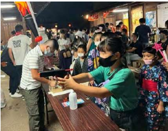
<懐かしゲームに夢中になっています>

7月23日（土）に岩村町商店会主催で「楽市・ふくろうまつり×土曜夜店」が開催されました。終日天候にも恵まれ、たくさんのお客さんにご来場いただきました。