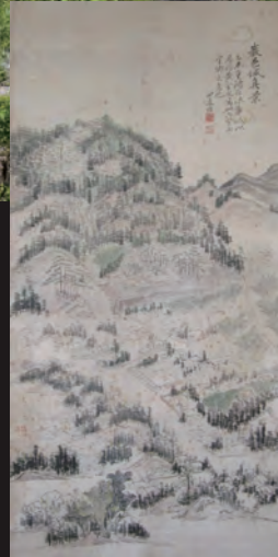
初公開「岩村城真景図」