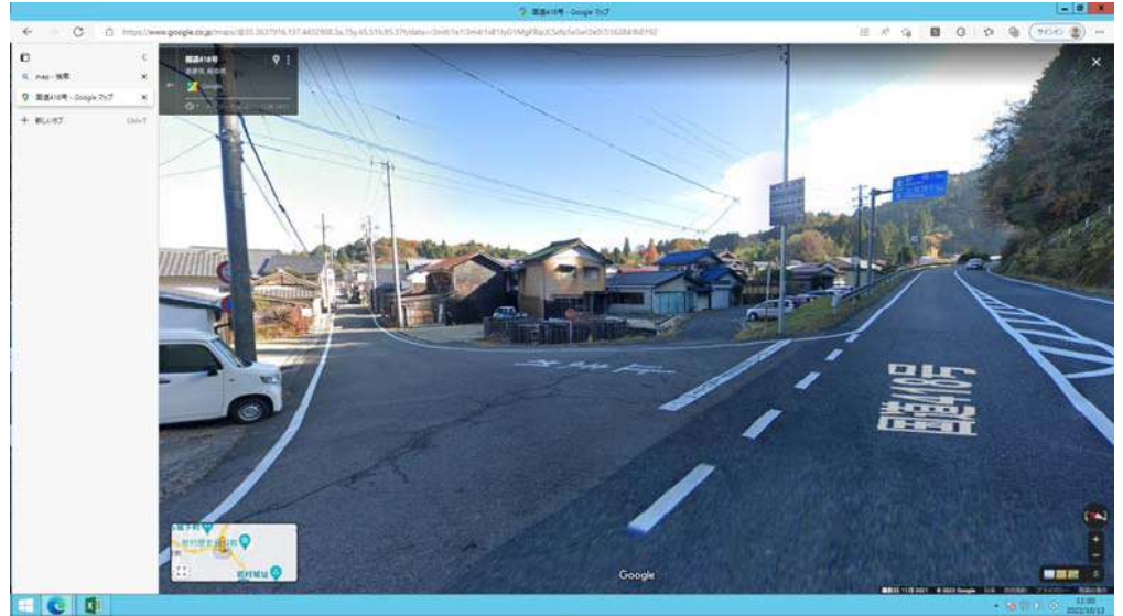
7) 国道418から支援学校