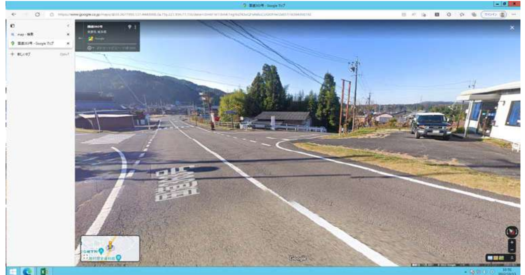
3) 三輪損保前交差点