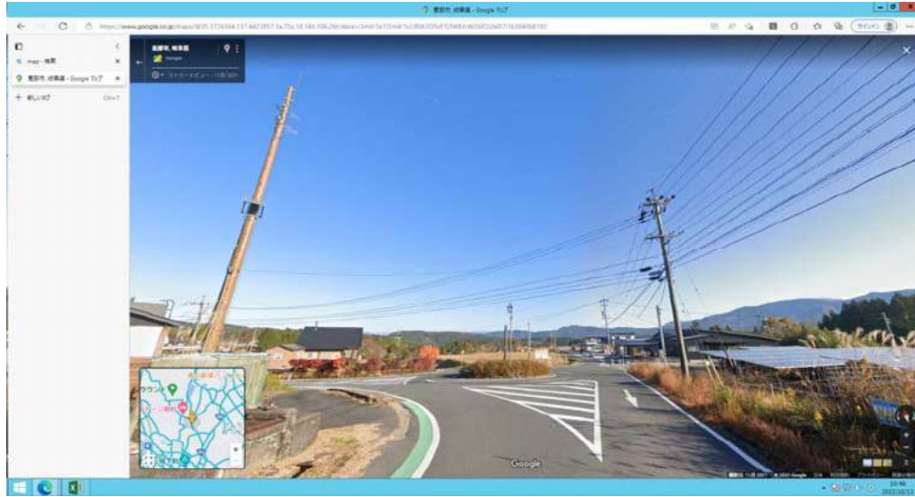
1) 中学校ロータリー