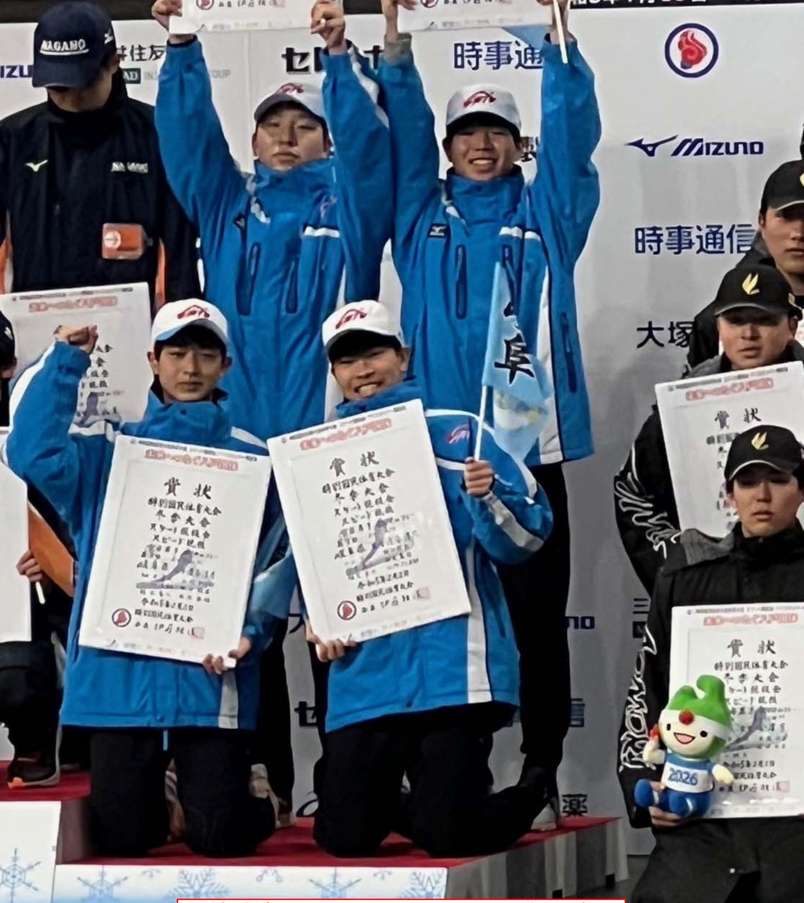
国体少年2000mリレー 3位入賞