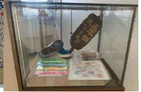
0.6 × 0.6 × 1.0