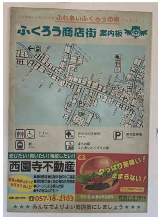
1.5 × 1