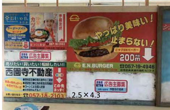
2.5 × 4.3