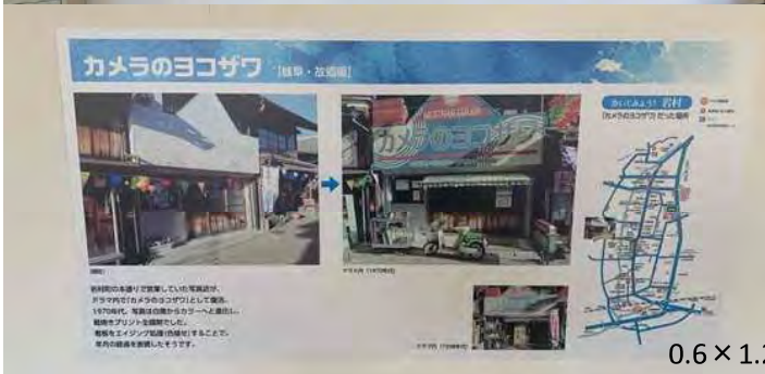
0.6 × 1.2