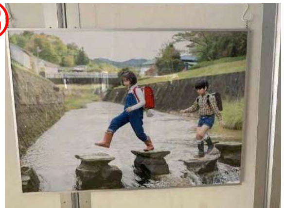
1.3 × 1.0