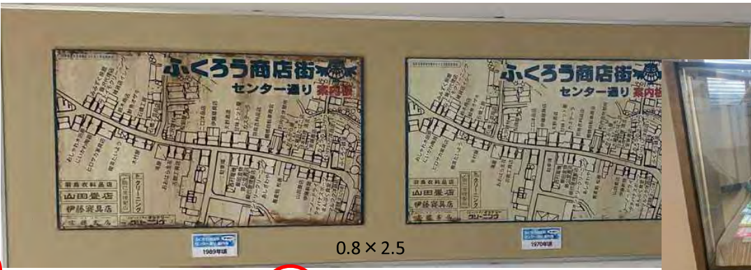
0.8 × 2.5