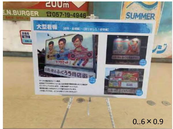
0.6 × 0.9