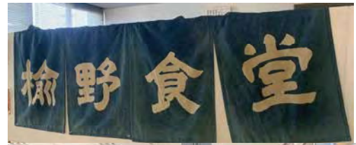
0.5 × 1.8