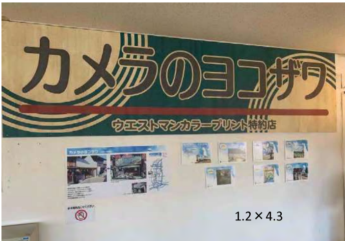
1.2 × 4.3