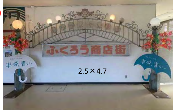
2.5 × 4.7