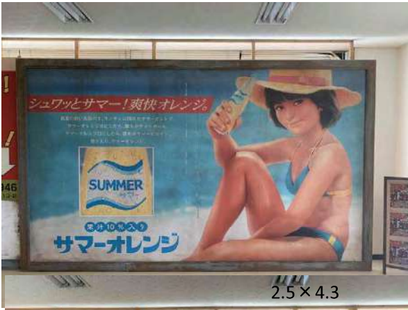
2.5 × 4.3