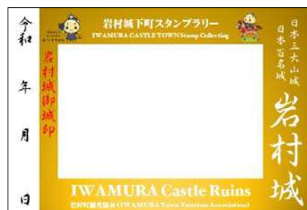
▲スタンプラリー台紙

この御城印の面白さは、『灰色』や『黒色』を押すまでどんな絵が出てくるか想像が付かないことにあります。是非お試しください。