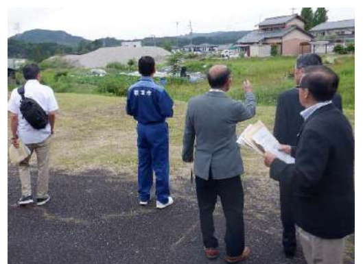
▲要望を受けた公園候補地の視察

市からのコメントは次の通りでした。①インフラ整備・町屋改修においては、市の補助金もあるので活用していただきたい。②飯地町では、会議や検討の際に必ず移住定住した方を入れている。このことにより考え方が変わったと聞いています。地域にあった商店も閉店したが、地域と移住してきた方で継承し売り上げを伸ばしているという事例もあります。昭和100年イベントは、是非やっていただきたい。③計画を立てていく段階で、どのような町にしようかと、みんなで考えていく時が一番充実している。たくさん話す機会を設けることで、より良い地域計画にしていきたい。問題解決に向けての財源は、自由度の高いふるさと納税を集めることをお勧めします。人口は減っていくものと想定し地域づくりを進めていく必要があります。