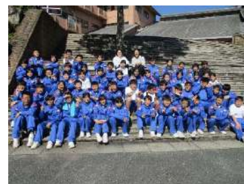
▲1年生の『旭高原研修』

1年生は5月9日（木）と10日（金）に、愛知県の旭高原自然の家で『旭高原研修』を実施しました。スプーン作りやオリエンテーリング、キャンプファイヤー、飯盒（はんごう）炊飯などの活動を行いました。中学校生活に慣れるために、4月の1カ月間はクラスの仲間と声を掛け合う毎日でした。その日常で高めてきた姿を、研修先でも発揮することができました。