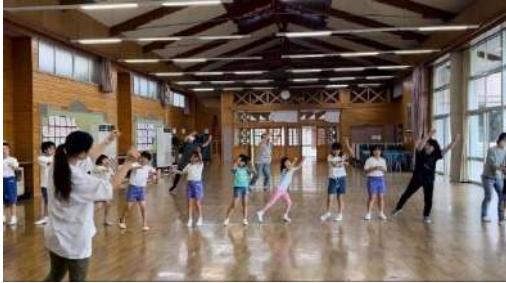
▲楽しく踊ったリズムダンスの様子

今年は、子どもたちの間で現在人気の「Bling-Bang-Bang-Born」の曲に合わせて踊ってみました。聞きなれた音楽で、みんな笑顔でノリノリ。楽しく踊れました。テンポが速く難しい所もありましたが、先生が一人一人に合わせて丁寧に教えてくださったお陰で、だんだん上手に踊れるようになりました。