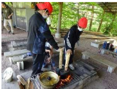
▲「炊けたかな」飯盒の音を聞く