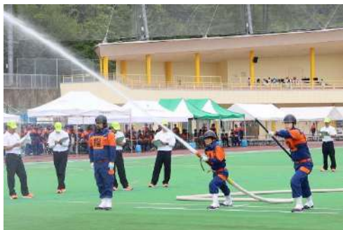
▲大会で操法を行う岩村分団

今年は、小型動力ポンプの部として大会が行われました。岩村分団は入賞とはいきませんでした。この大会に向け重ねた訓練で得た知識や経験で、岩村地域住民の生命財産を守っていただけていると思っています。「長期間の訓練、お疲れ様でした。」