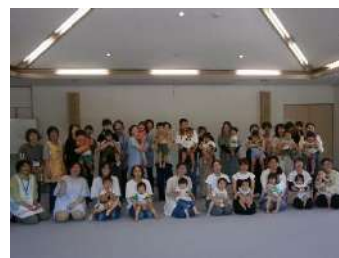
▲恵南乳幼児学級の参加者

6月12日(水)には、初の恵南合同乳幼児学級をコミセン大会議室で、19組の親子と主任児童民生委員6人の方に安全面で援助いただき、総勢50人で行いました。1年後の成長のあかしとして手形足形を取りました。年齢別のグループ分けでは、和気あいあいの雰囲気の中で子育ての悩みを話すなど、仲間意識が生まれたようです。次回は、7月10日(水)上矢作コミセンでドローン体験を行う予定です。是非、参加ください。