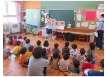
▲交通安全指導員のお話

6月11日(火)に、恵那市の交通安全指導員の方と恵那警察署の方による交通安全教室があり、年少児・年中児・年長児は交通ルールを教えてもらいました。交通安全指導員の方がパネルシアターを見せてくれたり、おまわりさんの話を聞いたり、とても集中して聞く子どもたちでした。