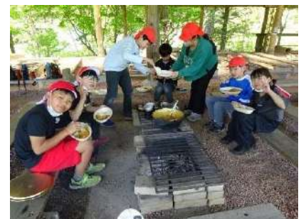
▲カレーライス「超おいしい！」