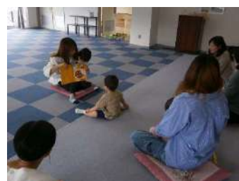
▲のびっこクラブの様子

5月20日(月)、あいにくのお天気で『明知鉄道に乗って』の遠出ができなくなり、コミセン大会議室にて5組10人で『絵本の紹介』を行いました。自分のお気に入りの絵本をお母さんが読み始めると、子どもは大慌てで駆け寄り「みせないで。よまないで。」を全開にして紹介どころではありませんでした。このかわいいうらぐさが、この瞬間瞬間に大切な思い出となっていきます。その後、お弁当をひろげ遠足気分を味わいました。