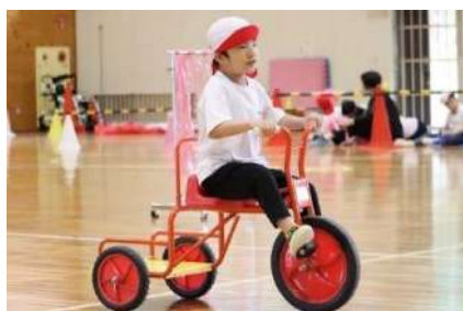
▲障害物競走の様子

多くの保護者の方々が参観してくださり、とても盛り上がった運動会・体育大会になりました。