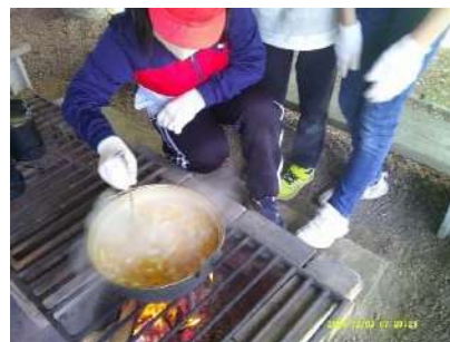
▲「いい匂い」カレーの出来上がり