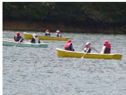
▲「うまく漕げるようになったよ」