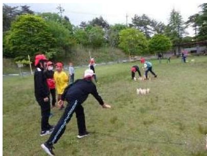
▲モルクに挑戦！「目指せ50点」

根ノ上研修で身に付けた力を今後の学校生活でも生かし、これからも仲間とともに、高学年としての力を伸ばしていきます。