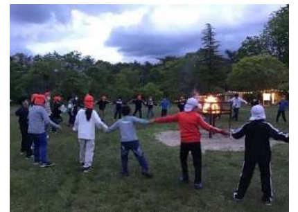
▲フォークダンスで盛り上がった