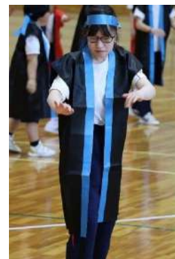
▲ソーラン節の踊り