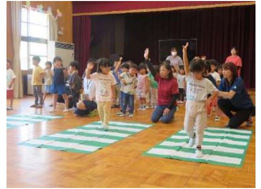
横断歩道を渡る練習。「手を挙げ注意して渡りましょう」▶

園では散歩へ行くこともあるので、この日教わったことを守って交通安全に十分気を付けながら過ごしたいと思います。大事な3つの約束『①わたしは ②必ず ③とまります』と指を出しながら確認しました。園でも家庭でも約束を忘れないようにしていきたいです。